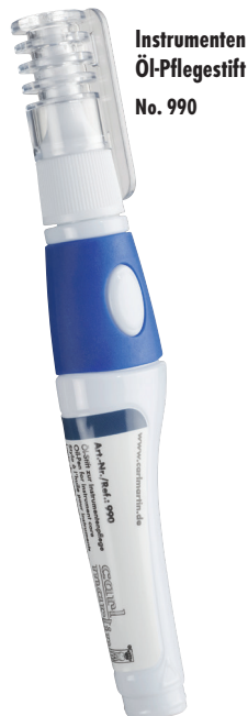
Instrumenten Öl-Pflegestift No. 990